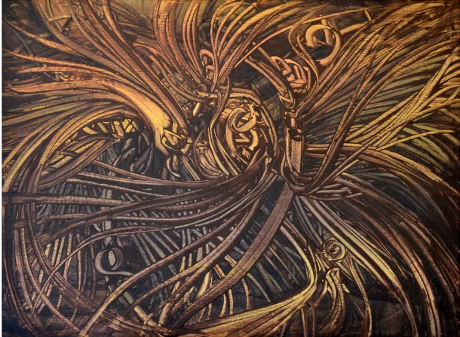
Sans titre - 1973 - 60x81 cm - Acrylique sur isorel